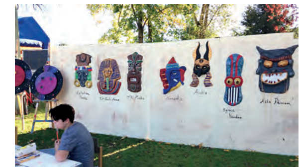
Die Masken-Objekte aus dem Herbst-Workshop auf dem Regionalmarkt Flammersfeld.