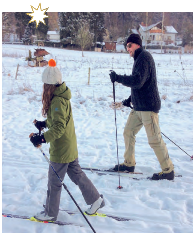
Neue Mobilität 2.0

Die Region Flammersfeld geht voran (...). Wir haben uns bewusst für das Dorf entschieden und sind glücklich damit. Uns fehlt es hier an Nichts, denn Fahren sind wir gewohnt. Alle Einrichtungen, die wir zum täglichen Leben brauchen, gibt es in der Nähe – in Flammersfeld, Horhausen, Weyerbusch und Altenkirchen. Und mal im Ernst – was soll an der Großstadt attraktiv sein? Dass man 1000 Meter zu Fuß geht um die U-Bahn zu erreichen (um dann unterirdisch noch mal 500 Meter zu laufen). Wir leben an der frischen Luft und nicht unter Tage. Wir können alles mit dem Lasten-Fahrrad oder dem E-Bike erreichen. Wir brauchen keine zwei Autos mehr, denn wir werden mitgenommen, weil man sich auf dem Dorf ja noch persönlich kennt. Und das soziale Leben kommt nicht zu kurz. Der „Treffpunkt - das Original“, immer dienstags