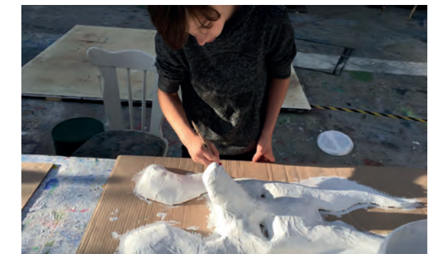
Maskenbau in der Werkstatt